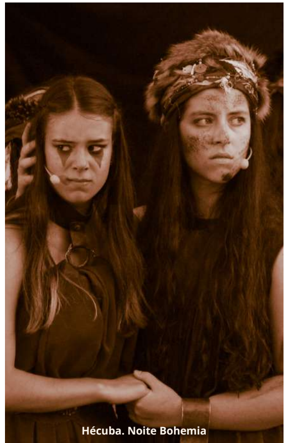
Hécuba. Noite Bohemia

Desde ESCENAMATEUR , mantenemos intacto nuestro compromiso por una salida de la crisis conjunta, apoyando al sector profesional en sus reivindicaciones, sin menoscabo de que la alternativa amateur tenga su espacio de acción y no en condiciones inferiores.